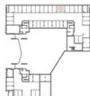
PLANTA ESTACIONAMENTO -1