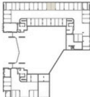
PLANTA ESTACIONAMENTO - 1